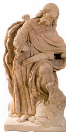
Escultura de San Lucas, siglo XVI.