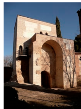
Puerta de Burgos, siglo XIII.

La vida de la villa se desarrollaba alrededor de algunos espacios singulares, y también en función de varias disposiciones normativas, como el Fuero Viejo, el Fuero Nuevo o las Constituciones (entre otros). Por último, la entrada en la Edad Moderna y la llegada del Siglo de Oro marcaron el final del mundo medieval, un cambio que simbolizan dos piezas soberbias, las esculturas de San Lucas y San Nicolás, ya de la segunda mitad del siglo XVI, con las que se cierra la exposición.