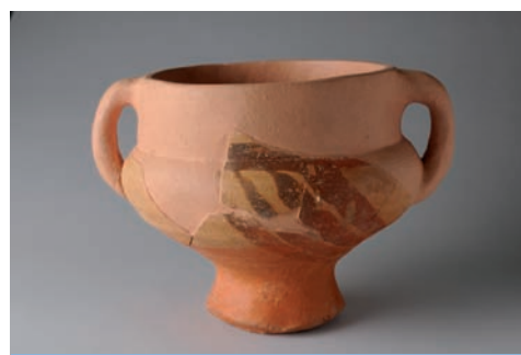
Copa de cerámica "de repoblación", siglo XIII.

La exposición permanente de piezas que aquí se muestra y el uso de recursos audiovisuales e interactivos, aportan una visión destinada al gran público hasta ahora desconocida de Alcalá de Henares. La visita al Centro de Interpretación está dividida en tres plantas, con temáticas bien diferenciadas, pero encadenadas unas con otras.