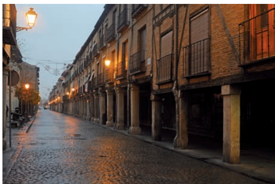
Arriba. Modelo virtual de la Calle Mayor en el siglo XIV. Abajo. Calle Mayor de origen medieval en 2009.