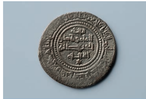
Moneda musulmana de al-Mamún, siglo XI.