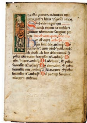
Fuero Viejo de Alcalá de Henares. Hacia 1235.

La visita se puede completar con las Murallas (a partir de mayo del 2010), Plaza de San Lucas y San Nicolás, Conjunto Monumental del Foro de la Ciudad Romana de Complutum, la Casa de Hippolytus y la Torre de Santa María.